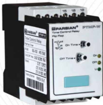
تایمر فیلیپ فلاپ (دو ولوم) مدل PTMF-W

On delay Time Adjustable Off delay Time Adjustable Timing LED Blinking